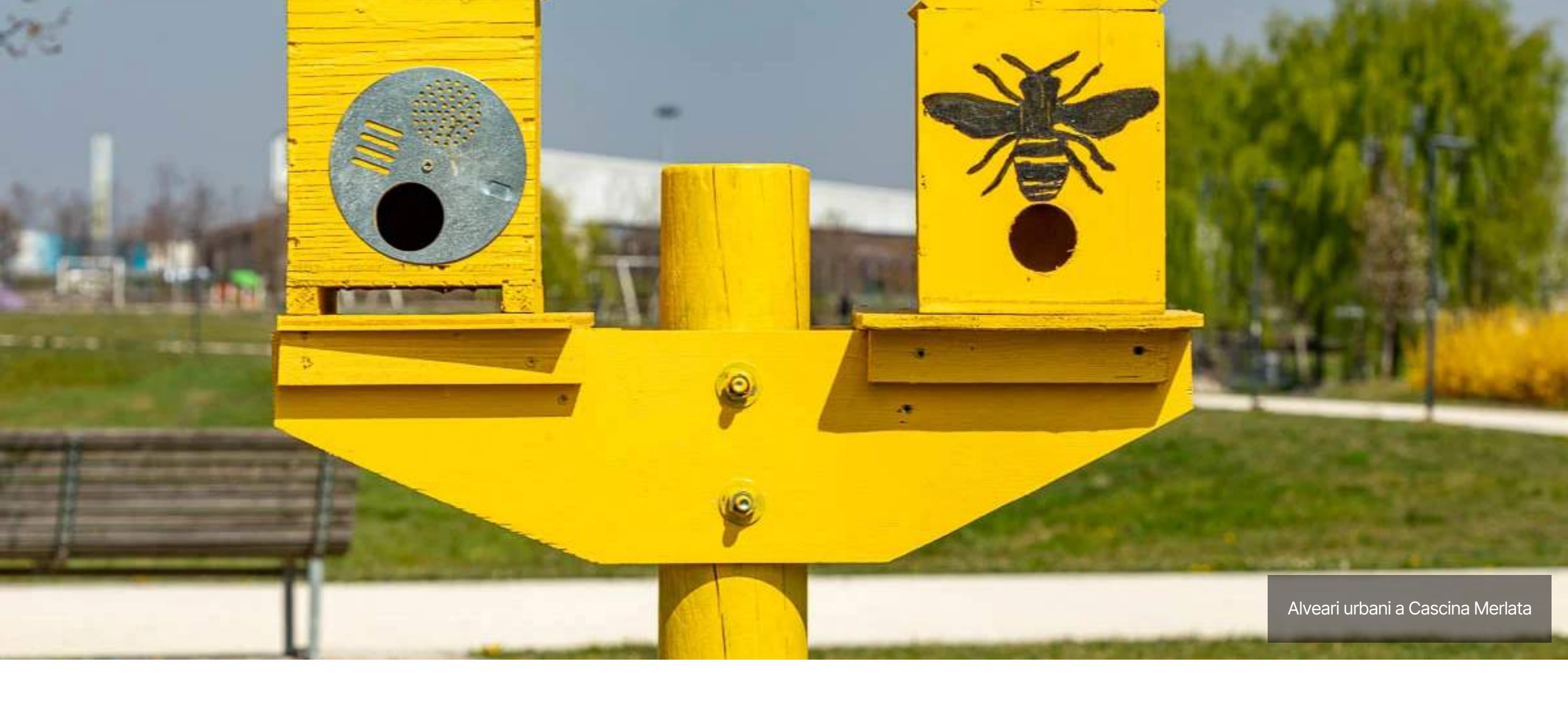
Alveari urbani a Cascina Merlata