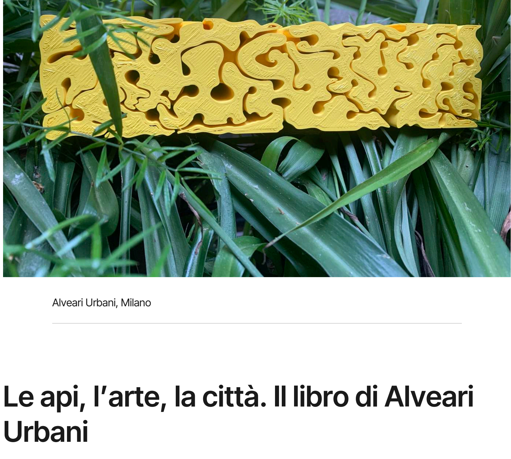
Alveari Urbani, Milano